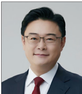
김성원 국회의원(경기 동두천시)