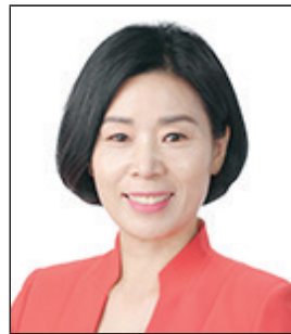
신경원 경기도 군포시