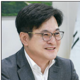
김병수 경기도 김포시장

사통팔달의 교통”과 “공감백배 소통” 등 혁신적 도시발전 전략 시민들이 안전할 수 있는 교통환경 및 정책들을 추진 김포시의 보행 및 교통 안전 추진과 건전한 교통문화 정착에 기여 노약자, 어린이, 장애인 등 교통약자들은 일상생활에서 교통의 불편을 느끼며 누구보다 안전에 취약하기에 이들을 위한 다양한 보호구역 정비 및 정책을 추진하여 어린이보호구역 정비 확대 추진과 노인보호구역 신규설치 등 교통약자들의 불편을 최소화하는데 노력