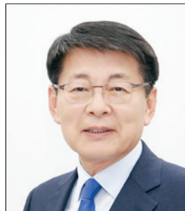
서삼석 국회의원(전남 무안)